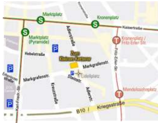
„Zum Kleinen Ketterer“ am Lidellplatz, Adlerstr. 34