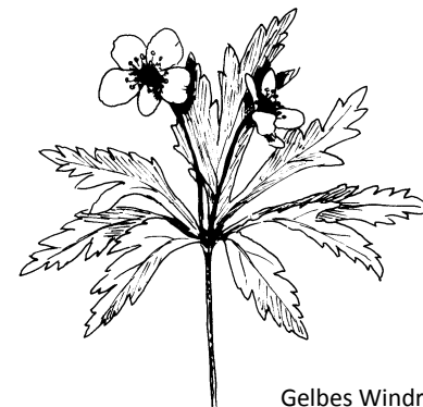
Gelbes Windröschen ( Anemone ranunculoides ) Zeichnung D. Schott

Botanische Arbeitsgemeinschaft Südwestdeutschland e.V. Botanischer Garten der Universität Tübingen