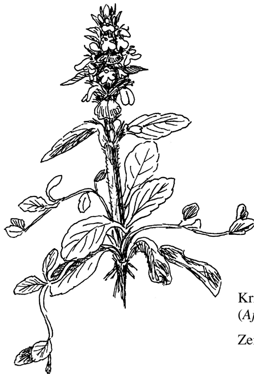
Kriechender Günsel ( Ajuga reptans )

Veranstaltungen und Termine Mitteilungen aus den Arbeitskreisen Fundmeldungen per Internet Erste Ergebnisse der floristischen Kartierung Exkursionsbericht TK 7225/1 Kooperationsvertrag Impressum